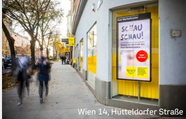
Wien 14, Hütteldorfer Straße