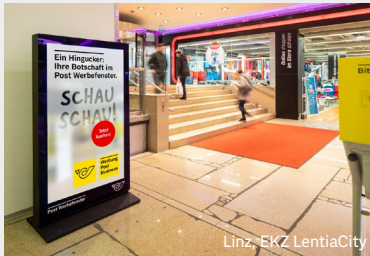
Linz, EKZ LentiaCity