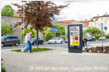
St. Veit an der Glan, Ossiacher Straße