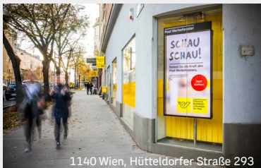
1140 Wien, Hütteldorfer-Straße 293