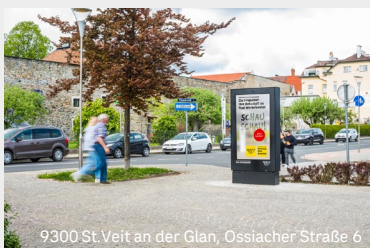
9300 St. Veit an der Glan, Ossiacher Straße 6