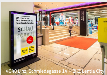
4040 Linz, Schmiedegasse 14 - EKZ Lentia City