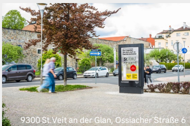
9300 St. Veit an der Glan, Ossiacher Straße 6