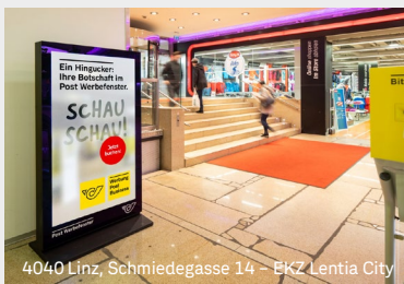
4040 Linz, Schmiedegasse 14 - EKZ Lenta City