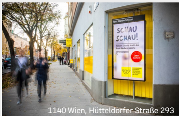
1140 Wien, Hütteldorfer-Straße 293