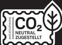
Schwarzweißanwendung neg. ✓