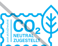
nicht in anderen Farben darst.