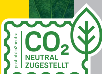
Anwendung auf anderen Hinterg. ✓