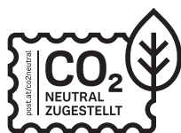
Schwarzweißanwendung pos. ✓