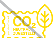
nicht in Gelb darstellen