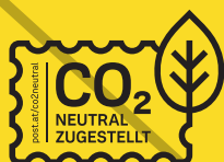
nicht Schwarz auf Gelb darst.