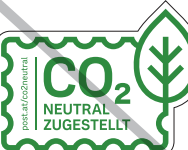
Keine Outlines verwenden