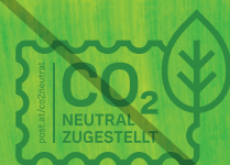
auf Bildern nicht ohne Hinterleg.