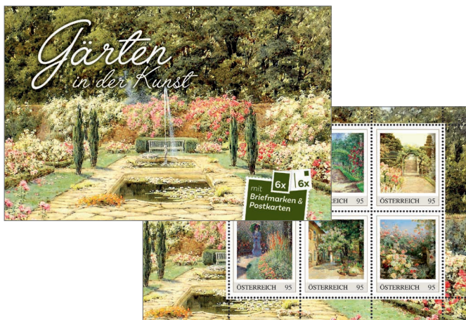
Postkarten Heft „Gärten in der Kunst“ – ab 01.03. erhältlich Mit sechs Postkarten und sechs Briefmarken im Gesamtwert von 5,70 Euro. 7,99 Euro pro Heft ● Bestell-Nr.: 624005

Alle Abbildungen entsprechen Symbolfotos. Änderungen und Druckfehler vorbehalten.