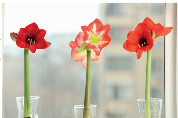
▲ Sehr dekorativ: Amaryllisblüten

Als Amaryllis werden mehrere Arten aus der Familie der Amaryllisgewächse bezeichnet: einerseits die aus Südafrika stammende, rosa blühende Echte Amaryllis, auch Belladonnalilie genannt, und andererseits auch Pflanzen der in Südamerika beheimateten Gattung Ritterstern ( Hippeastrum ). Beide Arten sehen sehr ähnlich aus, zudem enthalten beide das stark giftige Alkaloid Lycorin. Im Handel werden zumeist Ritterstern-Hybriden als Amaryllis angeboten. Sie werden im Spätherbst als Blumenzwiebel mit einem oder mehreren kleinen Blütentrieben verkauft und blühen dann rund um die Weihnachtszeit auf. Mit ihren zahlreichen üppigen Blüten in verschiedenen Rosa-, Weiß- und Rottönen auf einem langen Stiel ist die Amaryllis nicht nur eine beliebte Zimmerpflanze, sondern auch eine wunderschöne Schnittblume.