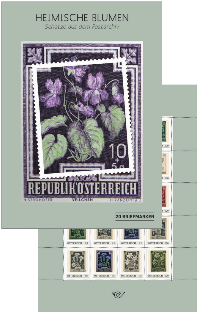
Marken Edition 20 „Heimische Blumen – Schätze aus dem Postarchiv“ – ab 01.03. erhältlich Mit zwanzig Briefmarken im Gesamtwert von 20,25 Euro. 25,50 Euro, im Abo 22,- Euro ● Bestell-Nr.: 124603