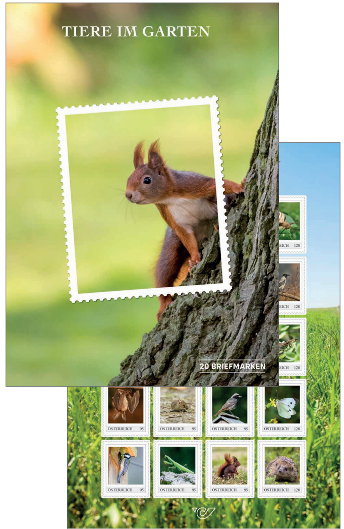
Marken Edition 20 selbstklebend „Tiere im Garten“ – ab 01.03. erhältlich Mit zwanzig Briefmarken im Gesamtwert von 20,25 Euro. 25,50 Euro, im Abo 22,- Euro ● Bestell-Nr.: 124604

Alle Abbildungen entsprechen Symbolfotos. Änderungen und Druckfehler vorbehalten.