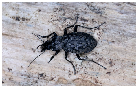
▲ Schwarzer Grubenlaufkäfer: Carabus nodulosus

Die Zeichnung stammt wieder von Alexandra Kontriner, die 2018/19 in Kooperation mit den Naturwissenschaftlichen Sammlungen der Tiroler Landesmuseen eine Serie von Kunstwerken unter dem Titel „Perikularium“ schuf. 29 Motive zeigen dabei Insekten, die in Österreich als ausgestorben oder stark gefährdet gelten. Auch Carabus nodulosus ist stark gefährdet: Die Trockenlegung von Sümpfen und Feuchtwäldern zur Gewinnung von Agrarflächen führt zu einem ständigen Verlust seines Lebensraums, denn er benötigt ein spezielles Feuchthabitat mit Mooren und Quellsümpfen, versumpften Ufern von Waldbächen sowie Totholz als Versteck und zur Überwinterung. Der Käfer ist nach den Flora-Fauna-Habitat-Richtlinien der EU geschützt, die Schutzgebiete zur Sicherung seines Bestandes vorsehen.