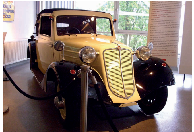
▲ Austro Tatra 57A aus 1938

Aus der Nesselsdorfer Wagenbau-Fabriks-Gesellschaft in Mähren wurde nach dem Ersten Weltkrieg die Ringhoffer-Tatra AG mit Sitz in Prag. In Österreich gab es anfangs nur eine Werkstätte, dann wurden hier auch Automobile montiert. 1936 wurde Austro Tatra als eigenständiges Unternehmen gegründet, die Fertigung erfolgte in Wien-Simmering. 1963 wurde Austro Tatra zur Ringhoffer GmbH, die 1980 schließlich geschlossen wurde. Den Tatra 57 mit „Bügeleisenfront“, luftgekühltem Vierzylindermotor und Zentralrohrrahmen entwarf der legendäre österreichische Automobilkonstrukteur Hans Ledwinka zu Beginn der 1930er, ab etwa 1935 folgte der 57A mit einem 1,15-Liter-Hubraum und rund 20 PS. In Wien wurde er als Austro Tatra 57A vor allem als Cabriolet, Limousine oder Klein-LKW produziert.