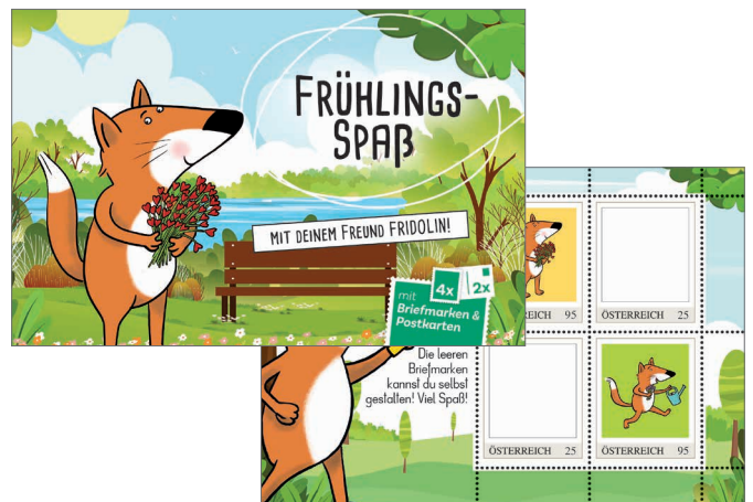
Postkarten Heft „Frühlingsspaß mit deinem Freund Fridolin!“ – ab 01.03. erhältlich Mit zwei Postkarten und vier Briefmarken im Gesamtwert von 2,40 Euro, eine Postkarte und zwei Briefmarken kann man selbst gestalten. 6,99 Euro pro Heft ● Bestell-Nr.: 624007